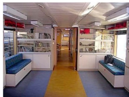
La salle Cousteau sert aux temps calmes, aux ateliers et aux moments de rassemblement

Le matin, il fallait attendre que les lumières du couloir soient allumées pour pouvoir se lever et monter déjeuner.